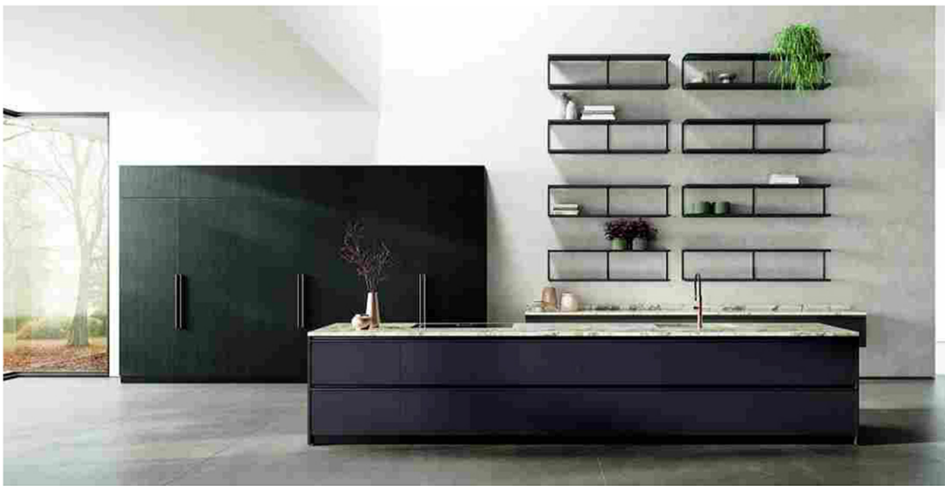
Scavolini: il nuovo modello Stilo firmato da Spalvieri & Del Ciotto

Home > Prodotto > Cucine & Design > Eurocucina | Scavolini presenta la nuova Stilo