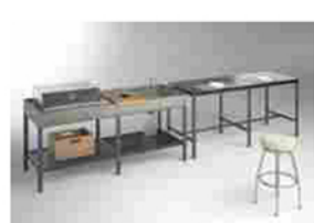
Fuorisalone | K-Garden, la nuova cucina outdoor di Ernestomeda