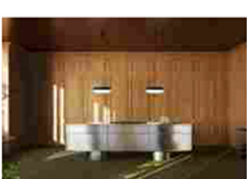
Eurocucina | L'Ottocento, dialogo tra classico e contemporaneo