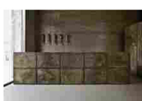
Fuorisalone | Le novità di minoticcucine e Maistri