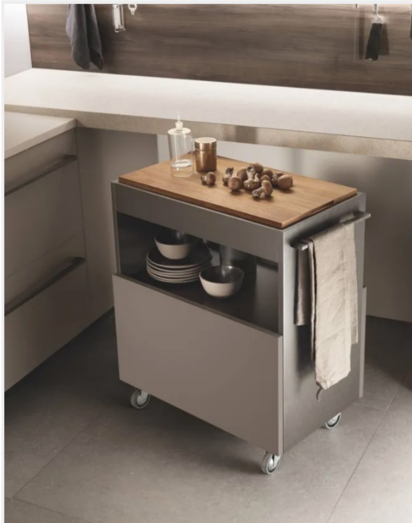
Carrello da cucina accessorio della cucina MIA by Carlo Cracco di Scavolini

Ha la struttura interamente realizzata in laccato Acciaio Scuro il carrello da cucina accessorio della cucina MIA by Carlo Cracco di Scavolini; è dotata di un pratico tagliere estraibile e di quattro ruote per spostarlo con facilità dove serve. Misura L 76,2 x P 40 x H 82 cm. Prezzo su richiesta. http://www.scavolini.com