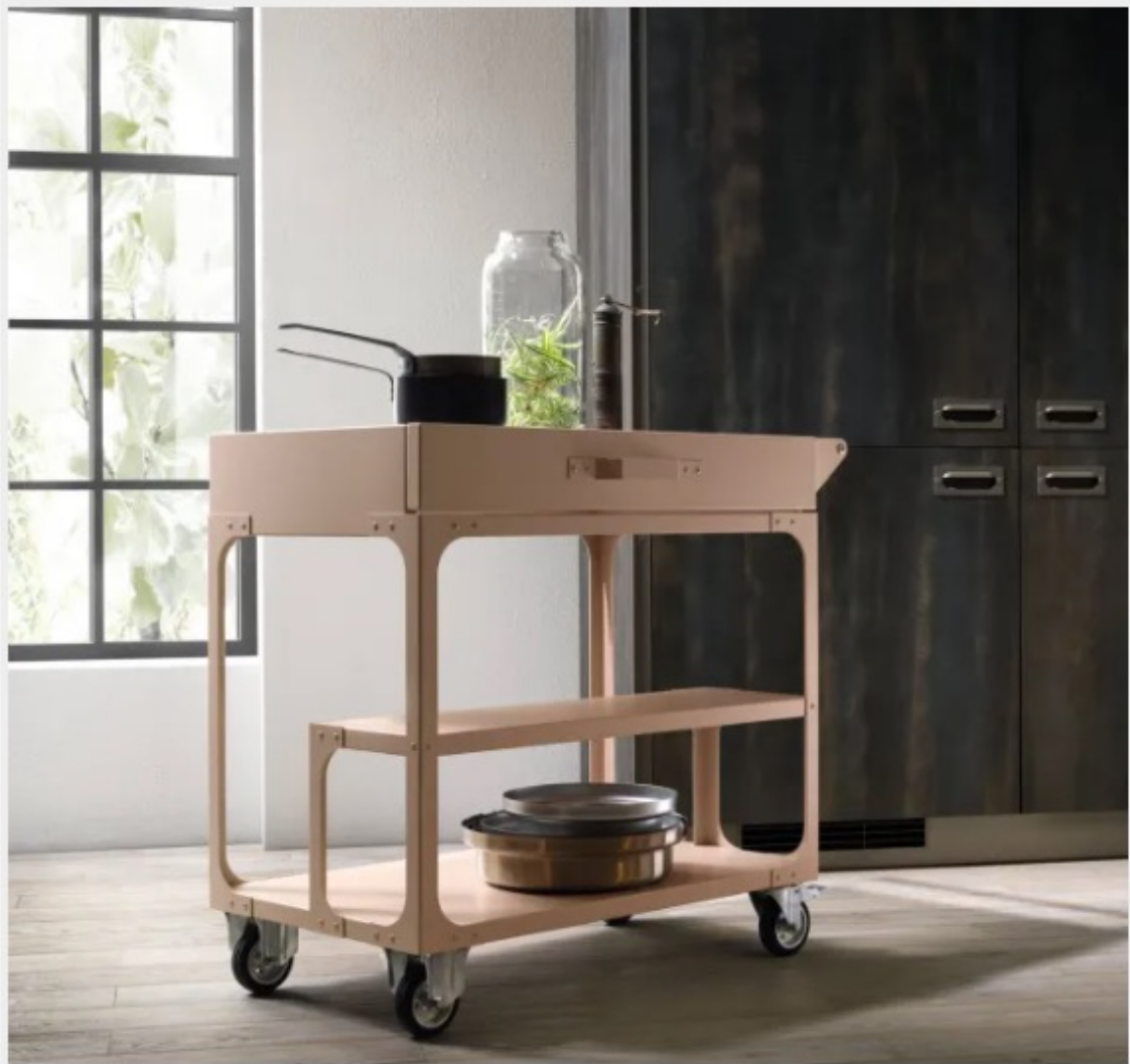
Misfit Cart della Collezione Diesel Living di Scavolini

Il carrello portavivande Misfit Cart della Collezione Diesel Living di Scavolini è completamente realizzato in metallo verniciato Dust Pink che lo rende solido e robusto; sotto il piano è presente un capiente cassetto con quattro vani. Le ruote sono piroettanti bloccanti e il maniglione può essere usato come porta canovacci. Misura L 51 x P 91 x H 83 cm. Prezzo su richiesta. http://www.scavolini.com